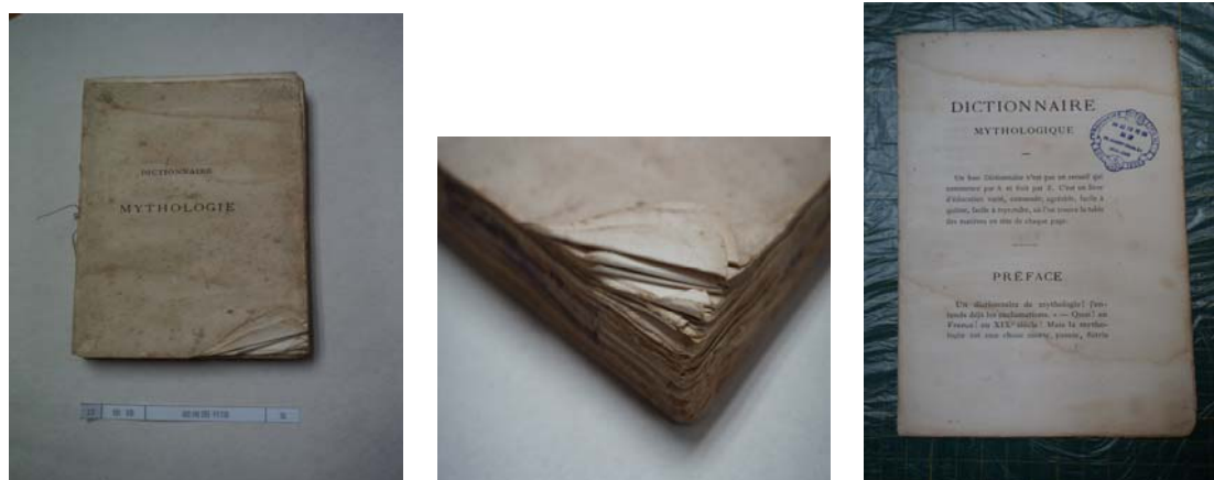
图 1 修复前破损情况

1.封面和书脊缺失。2.书芯有大面积水印，书页有折痕。3.右环衬和封底粘黏。4.装订线断裂。5.每一帖书的中间位置磨损严重。（见图 1）