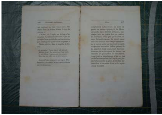
图 3.1 修复前的书页