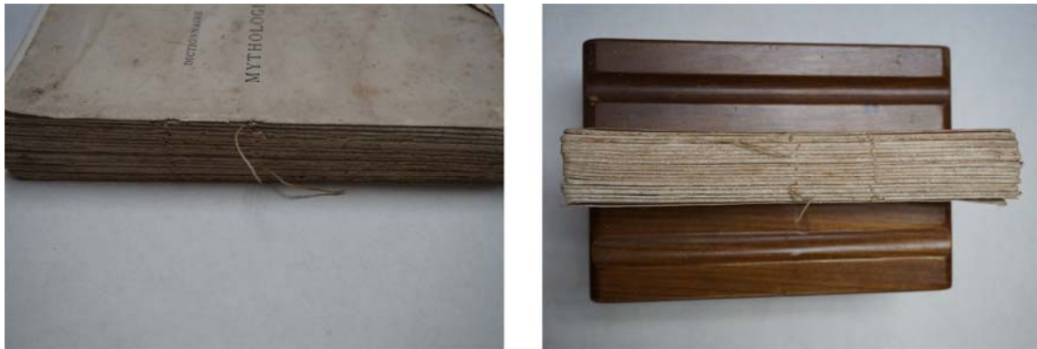
图2 线头断裂的书芯

因为之前图书装订用的棉线已经断裂，所以需要重新装订，可用镊子把线头慢慢拆掉，拆完后要按原来的顺序放好，以便于之后的修复活动顺利进行。（见图2）