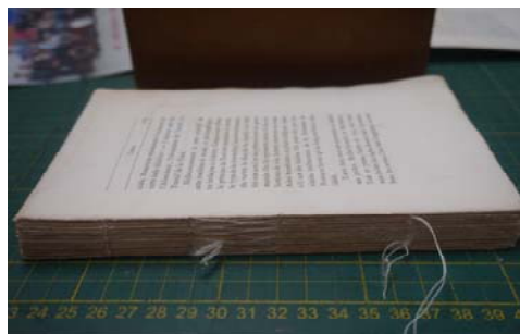
图 4 穿线装订

首先将书脊上涂抹浆糊，粘贴衬纸，再次涂抹浆糊，在书脊上粘贴一张稍厚的衬纸，并且用刮板刮平，再将书脊的顶部和底部与书对齐。